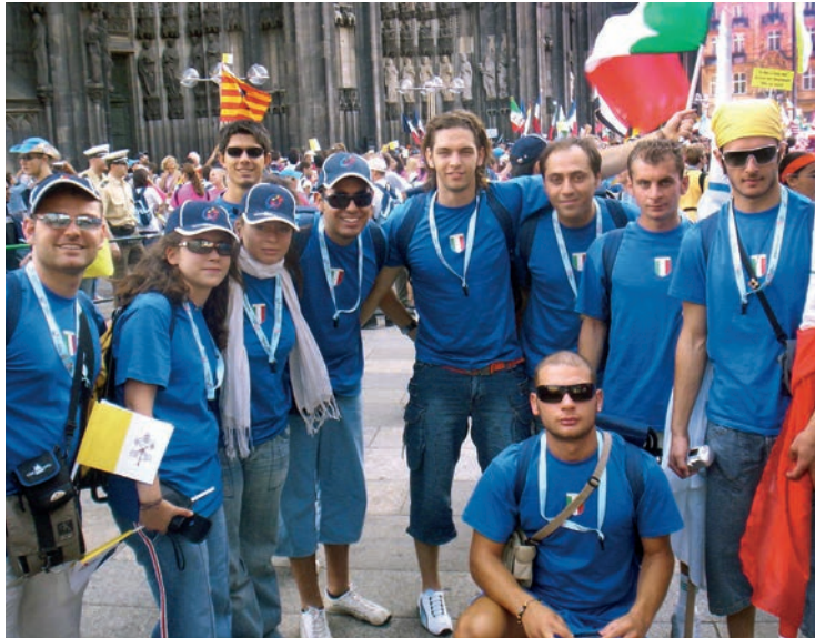
A sinistra: due giovani della parrocchia di S. Giacomo Maggiore di Barletta a Colonia per la XX GMG

L a Giornata Mondiale della Gioventù appena conclusasi a Colonia (Weltjugendtag - Kohn in tedesco) rimarrà nel ricordo di tutti e in particolare di chi come noi vi ha preso parte, per lo spirito di sacrificio, non solo per il fatto di doversi adattare a un ambiente diverso, a passare notti all'addiaccio, con clima e abitudini alimentari differenti dai nostri, ma anche purtroppo, per il mal funzionamento della macchina organizzativa tedesca, che ha mostrato tante lacune nell'assistenza di noi pellegrini. Ma anche questo è stato vissuto come il disagio del pellegrino, che deve sempre essere pronto ad adattarsi alle situazioni più disparate, perché la meta prefissa è più preziosa di ogni altra cosa. Ci siamo recati a Colonia con lo spirito di chi è